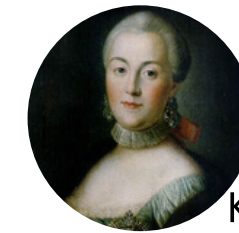
Katharina die Große