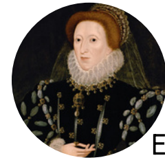
Elisabeth I. von England