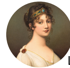
Luise von Preussen