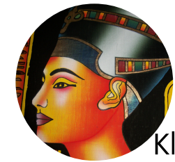
Kleopatra von Ägypten