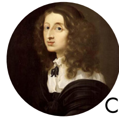
Christina von Schweden