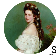
Sisi von Österreich